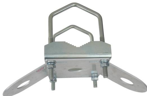
HIK100E TRIO + 2x Z5V105

profesionálny držiak pre uchytenie troch kamier HIKVISION, DAHUA, TVT a iných značiek na trubku alebo stožiar vo vertikálnej polohe