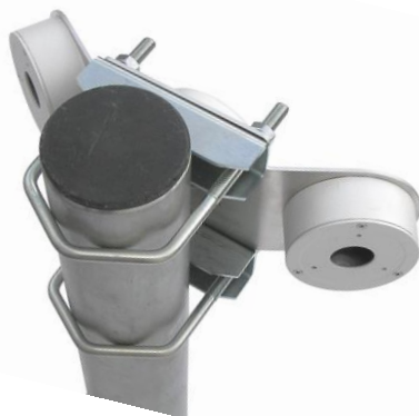
HIK100E TRIO + 2x Z5V105 montáž na trubku (Ø 90mm)